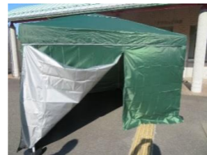
④ ワンタッチテント