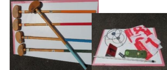
㉑ グラウンドゴルフ

保有数：6 セット (クラブ 36 本 ボール 36 個) ホールポスト 1 セット