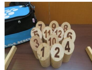
㉘ モルック/ミニモルック