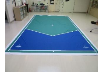
㉔ ボッチャハーフコート