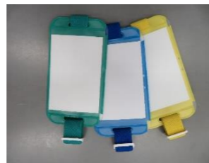
⑦ 腕章(10 枚入)