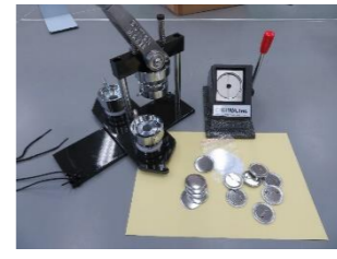
⑱ 缶バッチメーカー