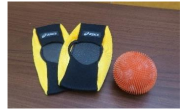
㉒ 室内用グラウンドゴルフ用品

保有数：6 セット (クラブ 36 本 ボール 36 個) ホールポスト 1 セット