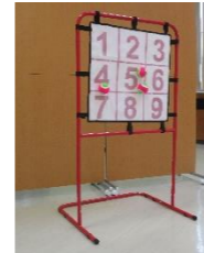
㉛ ストラックアウト