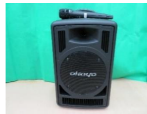
⑧ ポータブルアンプ