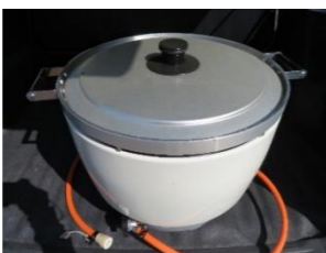
⑪ ガス釜(5 升炊き)