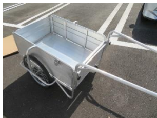
⑤ 折り畳みリアカー